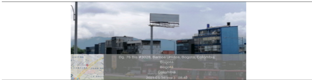
Foto 1. Vista panorámica del predio y de la valla ubicada en la Calle 78 No. 29 C 28 (dirección catastral), orientación Sur-Norte.