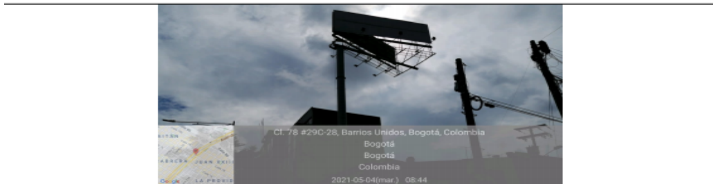
Foto 2. Vista del panel orientación Sur-Norte y de la estructura de la valla, en buenas condiciones y estable.